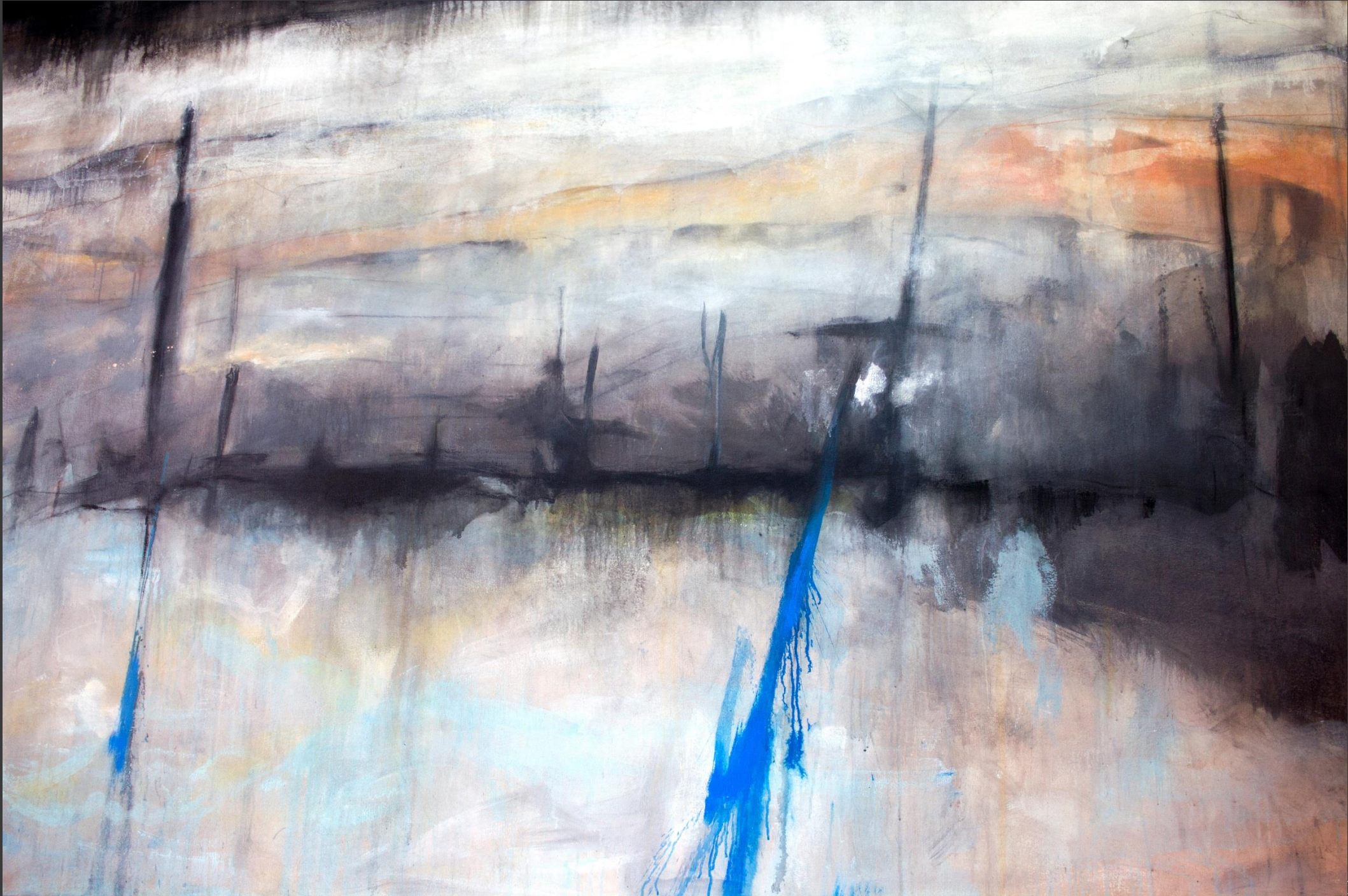
Zona metropolitana Año: 2018 Técnica: Acrílico sobre tela Medida: 180 x 290 cm (en proceso)